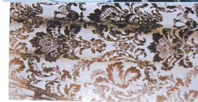
②バロック調のタテ柘唐草模様