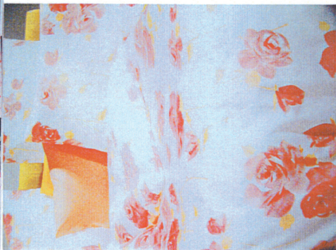
④一寸、ラフに描いたバラ