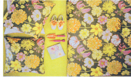
⑤'70年代に流行ったヌーボー調