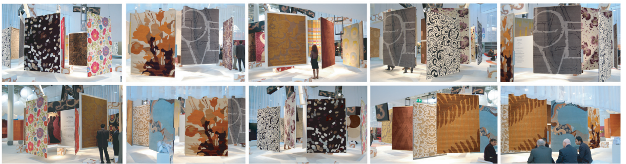
DESIGN カジュアルテーストのチェック・花柄・モダンテーストの大胆な幾何柄・シルエット調の草木/オーナメント/唐草パターン