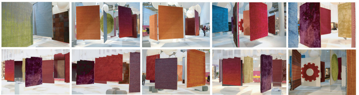
COLOUR 深みのあるダークパープル～ピンクパープルまでの幅のあるカラーリング・ポイントにYG/BL/OR

● 2009年 DOMOTEX …………… 2009 / DOMOTEX floor forum における STRUCTURE COLOUR DESIGN などの表現傾向。