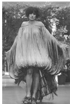
国際天然繊維年コレクション 2009・ローマより