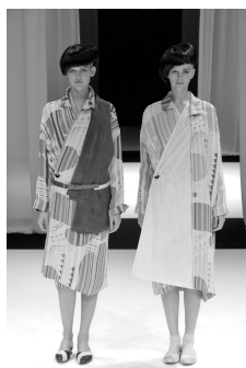
“纏”コレクションより