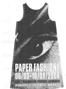
“PAPER FASHION” 展示ポスター・アントワープ

いるのだという実感と圧倒的なスケール感を受けました。心打たれたのはビジネスだけでなく地元子ども達への楽しいワークショップ等も企画し心の触れ合いを大切に行っていることでした。数値のみを追いかけてきた日本ビジネスのあり方も反省の時を迎えているのを感じました。ベトナムはフランスの植民地統治や長いベトナム戦争の悲劇がありましたが、やっと手に入れた自分達の国づくりに懸命な努力を惜しまない若いエネルギーの漲る国だと思いました。