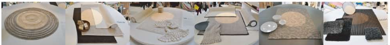
オーガニックやエコ感覚をベースにストラクチャーや素材感を打ち出したラグ