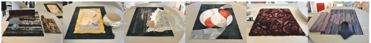
レザーパッチワークでデザイン表現されたラグやレザーにファーを加え深みのある凹凸感を表現したラグ・レザーに光沢感加えレザーカットでデザイン表現されたラグ