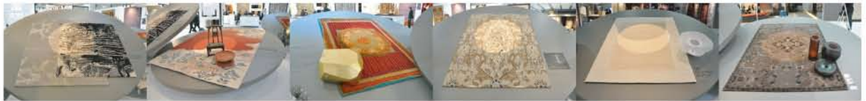
オーセンティックでデコラティブな表現のラグ