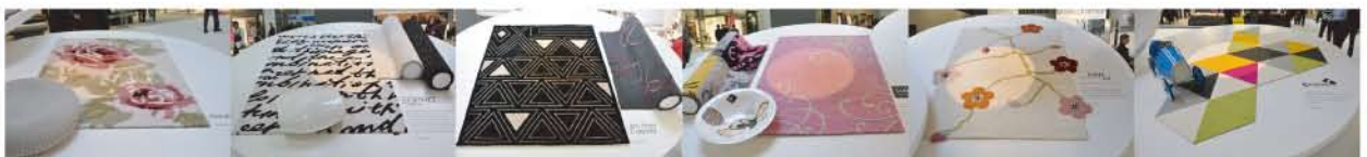
ドラマチックでパワフルな表現のラグ・新たなジオメトリックの流れを感じさせるラグ・厚手のフェルトを使い組み合わせを楽しむラグ