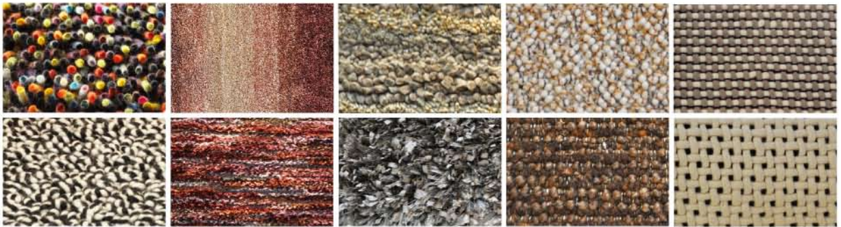
STRUCTURE ストラクチャーのテーマは昨年に引き続き大事なポジションにあり、上質感溢れるオーガニック調の多彩なウール使いは継続/プラスの要素はカラーミックス調の拡大/こだわりのある凹凸感のテクニク