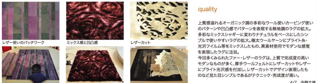
レザー使いのパッチワーク