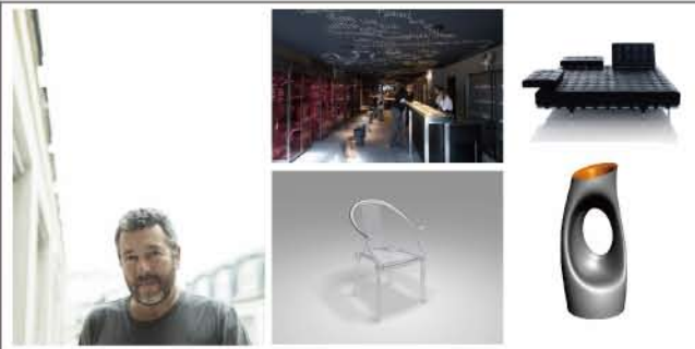
Philippe Starck 建築・インテリア・家具・食器・出版物・インダストリアルデザイン等さまざまな分野のデザインを手がける総合的なデザイナー。1949年 フランスのパリに生まれ。