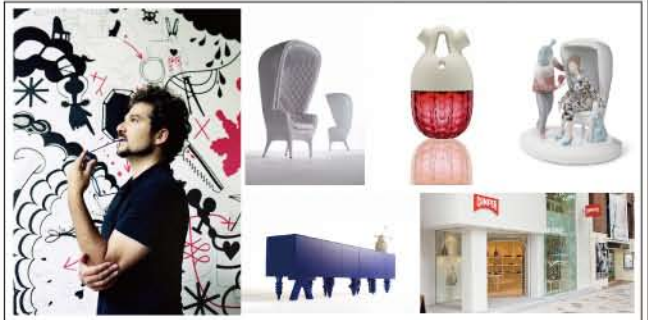
Jaime Hayon 1974年、スペインマドリッド生まれ。2004年に独立。スペインバルセロナにアヨンススタジオを設立する。LLADRO (リャドロ) やカンペールなどを手掛ける。