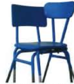
ふたつのものより、より合わせた場所の方がいい。人はカップルとして、新たな世界を構築している。運動的なデザインを統一。統一によって新たな世界が生まれていく。愛情（すなわちユニークな関係の一部）の美しさ。

COUPLICITÉ CONCEPTION VINCENT GRÉGOIRE - HELLFROD