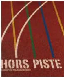
新しいデザインへのユニークなエネルギーは、スポーツフィールド上にある。大きなスポーツフィールドは歩道を上回る。歩道で通るし歩まない歩道は歩かないながら、自動車やプロシエから別のデザインへの提案は、今までに見えぬ新しいものを提案させる。

9月9日～13日パリのノール見本市会場にて、メゾン・エ・オブジェが開催されました。今回は7万144名の来場者が訪れ、また、3.11を受け、日本の東日本大震災復興支援の特別企画も2つ開催されました。