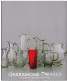
少量のものと美しいものは、無量や過剰の数量になり、独自の数量や、たくさんある量、可憐へ。日常の量、平気、日常、日常、日常の量からくる、個人的なこだわりから生まれる芸術。