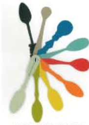
収集することが喜び、コレクトカラー

カラーとしては、アパレルの方向性と同様、カラフルな傾向が強い。色相も幅広く捕えられている。