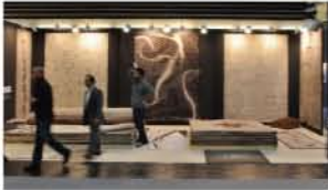
ウール使いの無地調カラーなど世界的なエコブームにより素材色をいかしたナチュラル系カラーに注目