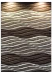
草木柄・オーナメントパターンの減少、ハイ・ローや凹凸感・カービングを使った大胆なモダン系花柄や大柄の抽象パターンがメイン

伝統とモダンのミックス、大胆に構成されたシルエット調オーナメント・唐草パターン、様々なテクニクで継続 ドローイング感覚の大胆な抽象パターンの拡大 ハンドメイドによるビンテージ感覚(パッチワーク)のデザイン拡大傾向 モダンテストの大胆な幾何抽象パターンとデジタルアートのパターンは継続