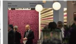
多彩なパープルを基調にOR/Rが加わる