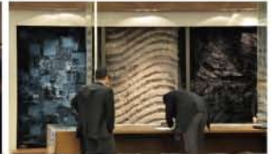
アイリスブルー・ジュンパーグリーンに注目