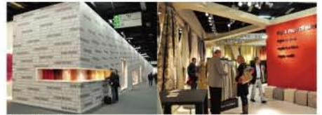
PURE TEXTILE 2011

photo-3 から ... 柔らかくソフトなパステルカラーに注目、多彩なピンクゾーンは継続