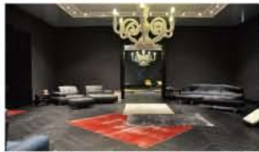
拡大しているビンテージ/パッチワークカーペット