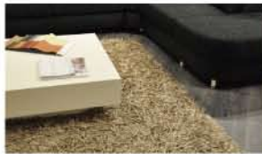
極太糸使いのシャギーカーペット・ベッドシーンでのラグの使用例