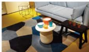
カジュアルラグとレザー敷物