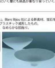
隣で行われていた特別展示「Blanc Bijou」。Blanc Bijou社による新素材、鑽石を細粉し白くしたものを固めて、新しくプラスチック成形したもの、固く、いつまでも白く、温かみを持ち、なめらかな肌触り。