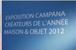
こちらも同じく受賞を記念し、会場内で展示を開催。