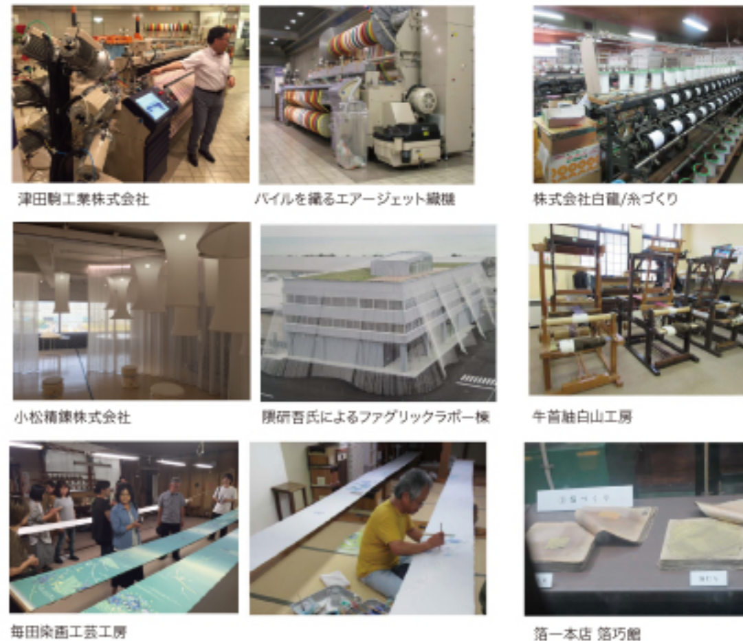
津田朝工業株式会社 パイルを織るエアージェット織機 株式会社白龍/糸づくり 小松精練株式会社 隈研吾氏によるファブリックラポー棟 牛首袖白山工房 毎田染面工芸工房 第一本店 箔巧館

7月2日 ~伝統工芸編~ 10:00 金沢駅集合 11:00-12:00 西山産業(白山、牛首袖) 12:30-13:30 昼ご飯 14:30-15:30 毎田染面工芸工房(加賀友禅) 16:00-17:00 第一本店 箔巧館(箔製造、販売) 17:30 解散 参加人数:14名参加(うち6名がTDA会員)