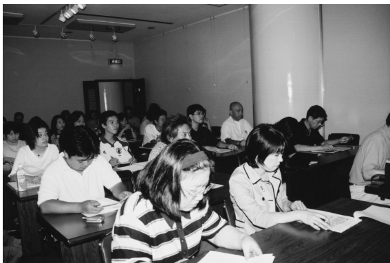
7月の暑さを忘れて熱心に受講 スクール-2

テキスタイルデザインスクールをスタートして4回を終えたわけですが、これまで3回の講師を担当してきたことは、具体的な講義内容を構成していく段階で盛り沢山の内容をいかにコンパクトに行かかという難しさです。また、スクールの計画段階では、受講される皆さんはプロであり、基本的な内容は周知の事、既成の出版物などでも勉強されている(あるいは勉強していただく)、講師をする人も知っている事を講義するという知識の伝達ではなく自らも勉強になる内容を構成する、という前提でカリキュラム内容を構成するというものでした。しかしながら実際にやってみて判ってきた事は、受講者はプロであっても仕事のカテゴリーとキャリア年数などの違いによって講座の内容が一通りでは済まない、と言うことです。一回の講座を2時限ないし3時限でおこなうと、1時限あたり50分ないし80分ということになります。この短い時間内で要領よく凝縮するにしても、受講する立場からするとこの部分をもっと突っ込んで欲しいというような不充足感が残る場合も出てくるということです。ある意味では嬉しいことでもあるのですが、このようなより専門的な内容構成を今後どうして行かか課題として見えてきたという事でもあります。