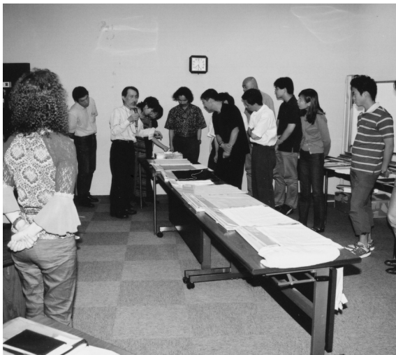
スクール-4 素材サンプルの解説を聞く