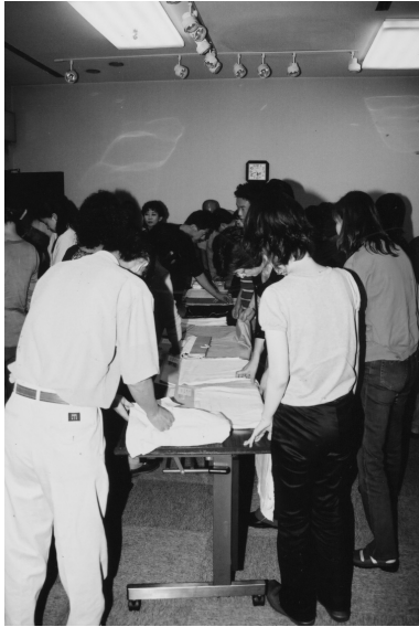
スクール-4 サンプルを実際に手にとって確認