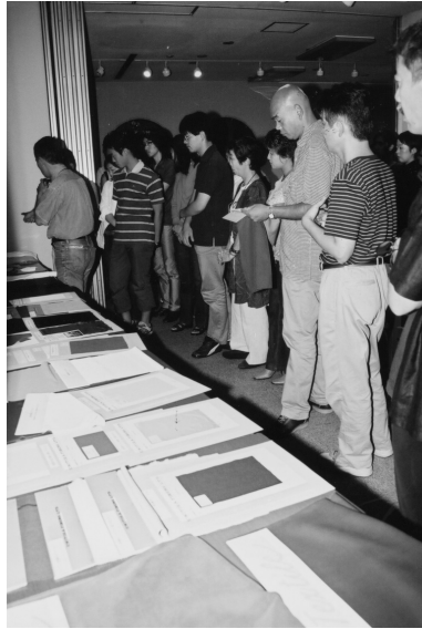
スクール-4 合織と天然繊維、沢山集めました